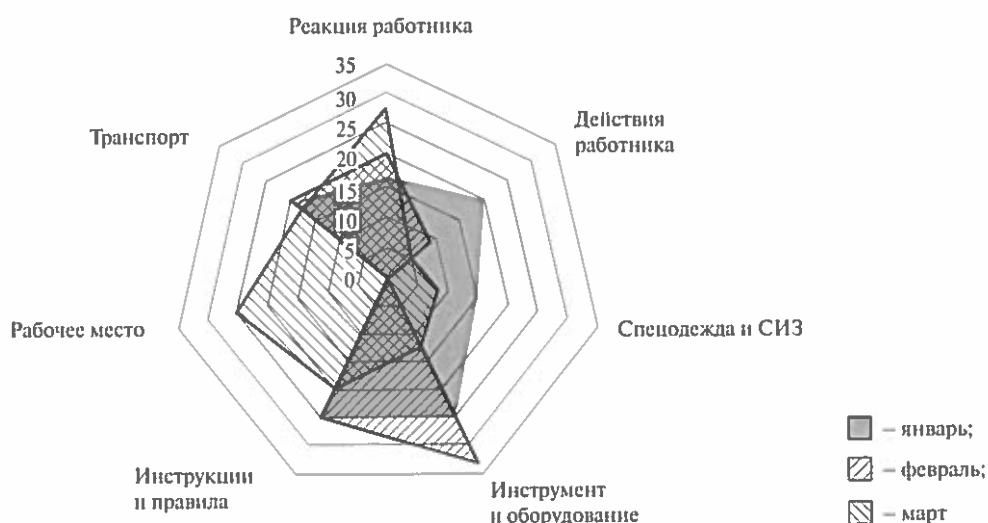
Рисунок 2 – Построение графика изменения N_{ionp} подразделения в течение одного квартала

8.10 Области пересечения областей N_{ionp} на диаграмме отражают категории, частота критериев с показателем «опасно» которых в относительных величинах преобладает и которые нуждаются во внимании и принятии решений со стороны руководства для предотвращения потенциальных опасных событий.